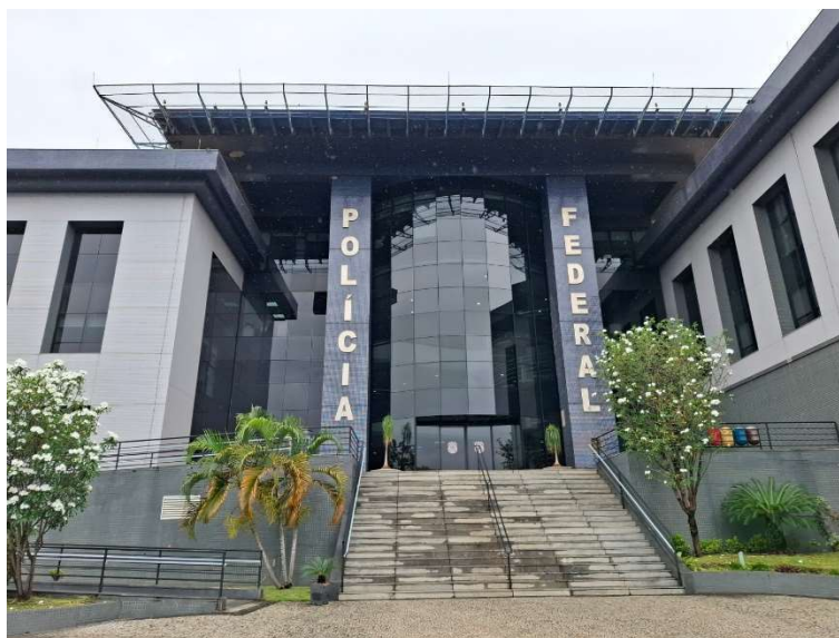
Figura 01 – Fachada frontal

O relatório visa proporcionar uma visão clara e objetiva das características físicas do local, contribuindo para a transparência do processo licitatório e para a precisão técnica na elaboração, análise e comparação das propostas apresentadas pelas empresas participantes.