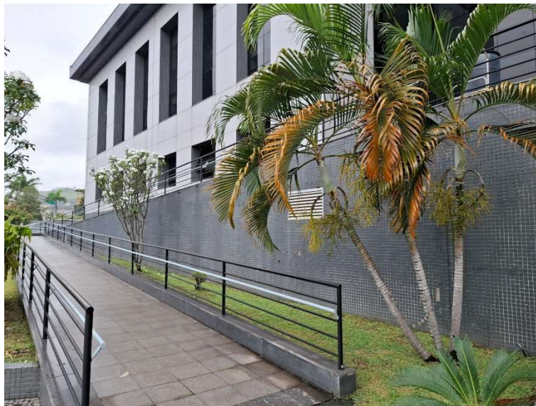
Figura 10 – Fachada frontal