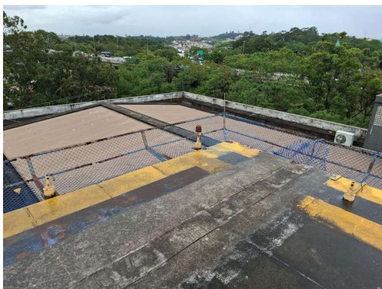
Figura 17 – Prolongamento de laje