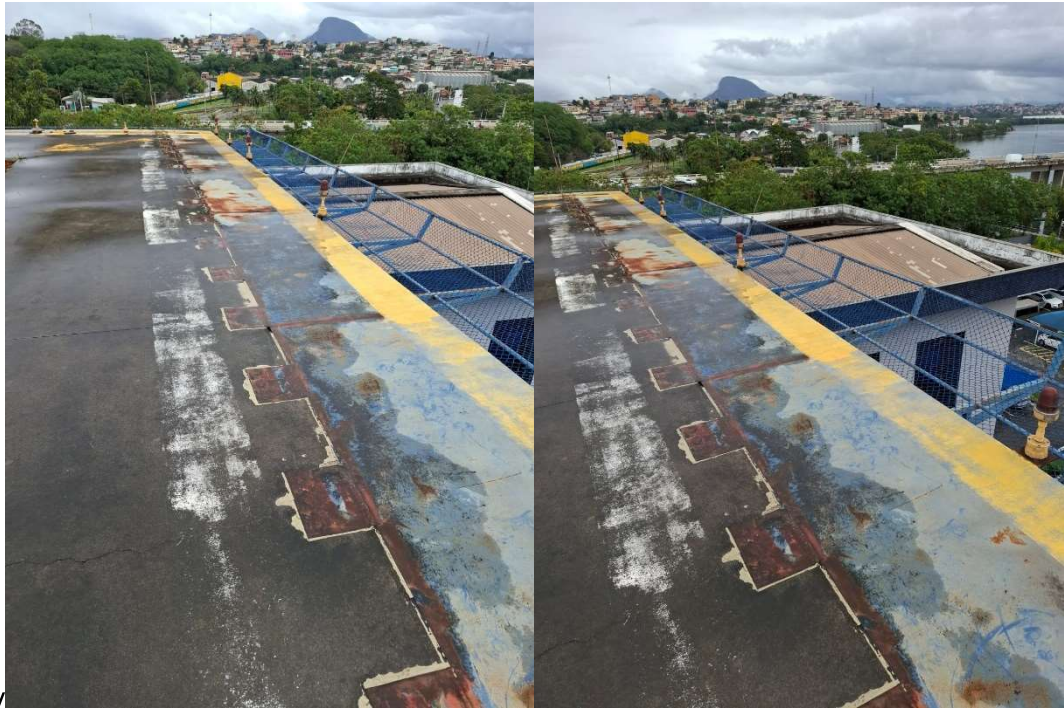
Figura 12 – Prolongamento de laje