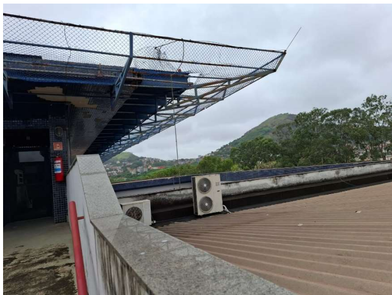
Figura 09 – Prolongamento de laje