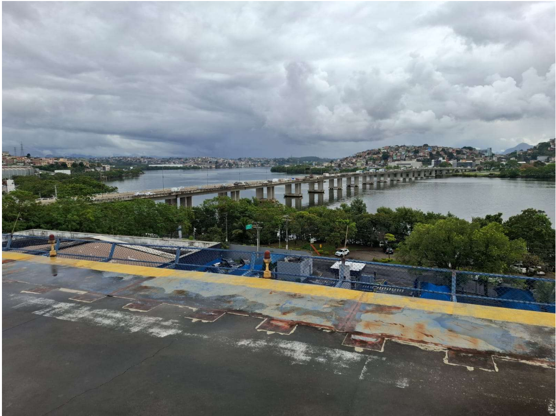
Figura 14 – Prolongamento de laje