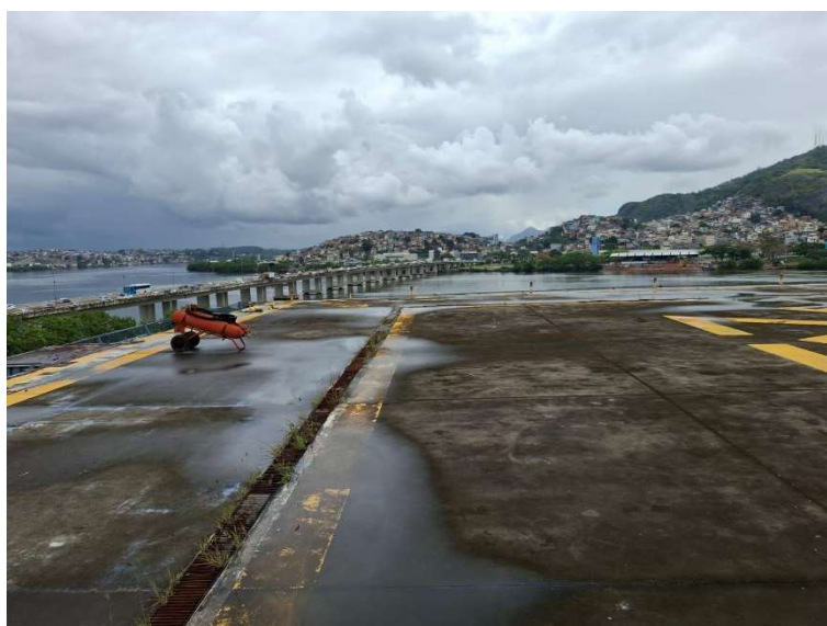
Figura 19 – Prolongamento de laje

Documento assinado digitalmente gov.br GUILHERME CUNHA GUIGNONE Data: 17/11/2025 10:35:33-0300 Verifique em https://validar.iti.gov.br