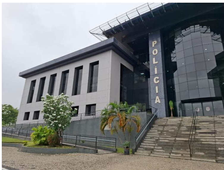
Figura 02 – Fachada frontal