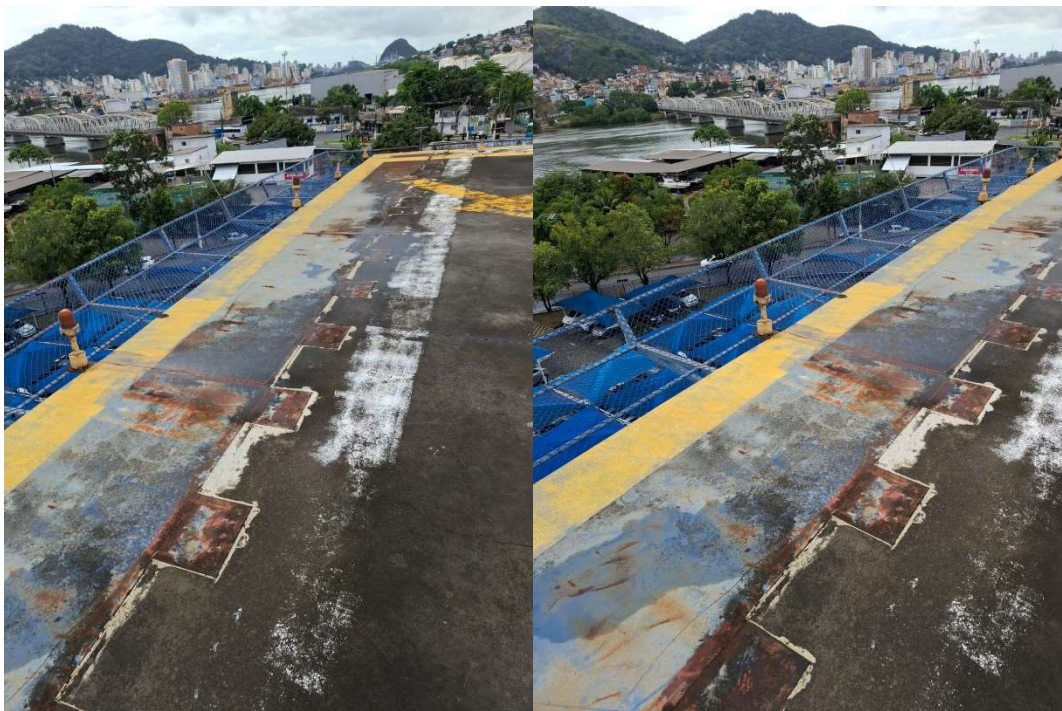
Figura 13 – Prolongamento de laje