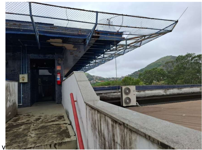
Figura 08 – Prolongamento de laje