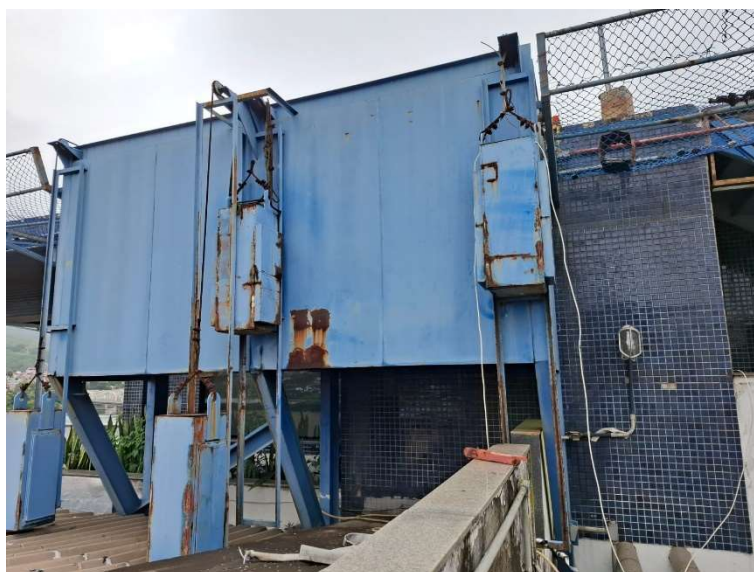
Figura 06 – Plataforma elevatória