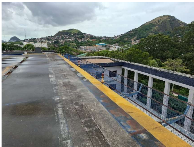
Figura 16 – Prolongamento de laje