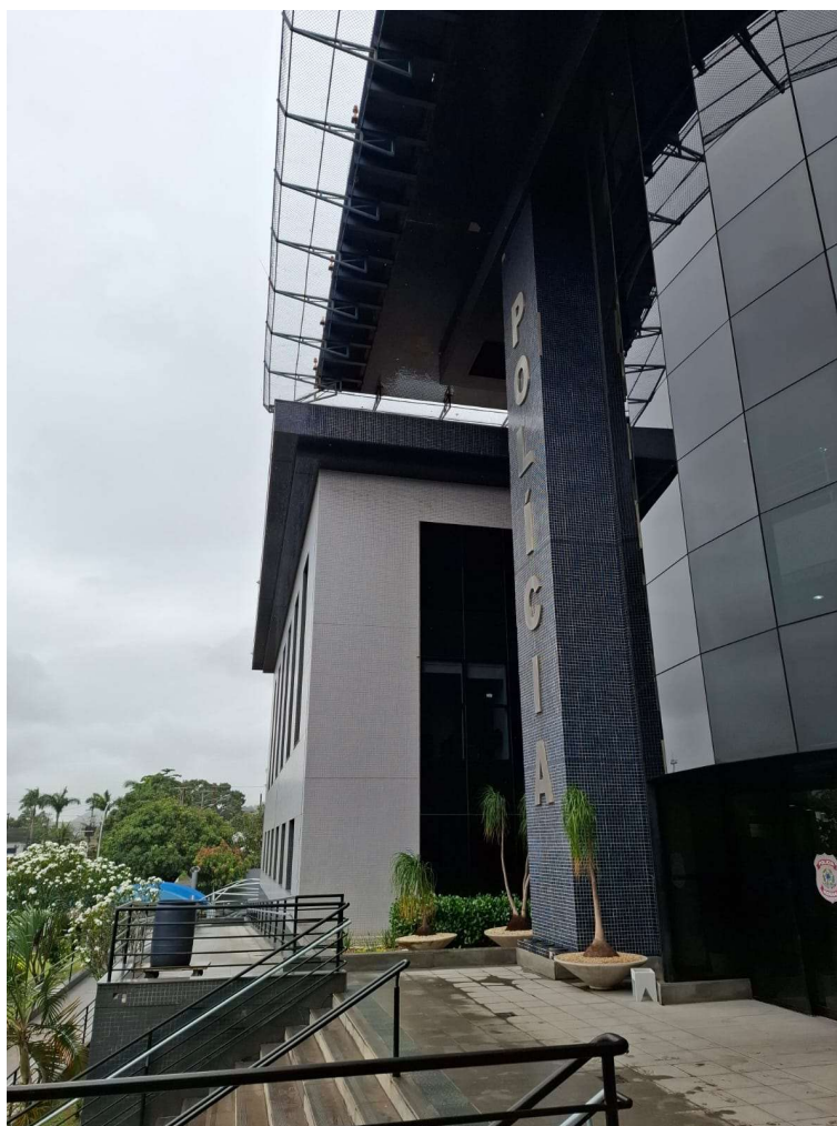
Figura 11 – Detalhe fachada frontal