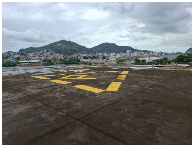
Figura 18 – Prolongamento de laje