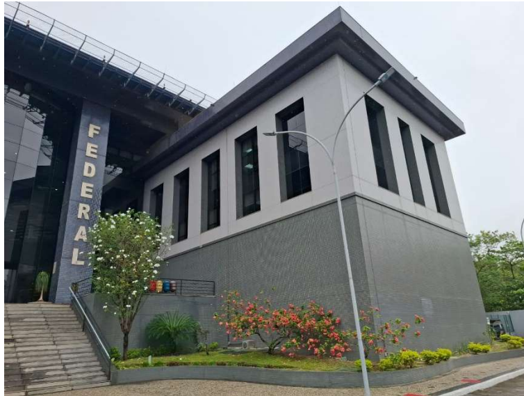
Figura 09 – Fachada frontal