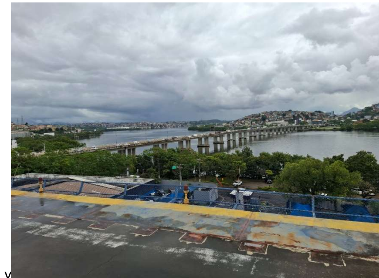
Figura 15 – Prolongamento de laje