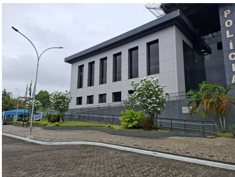
Figura 03 – Fachada frontal