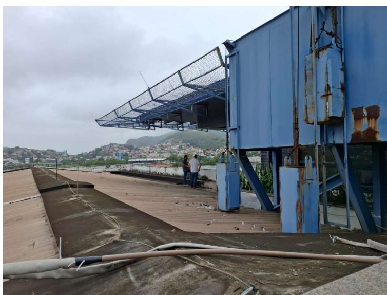
Figura 07 – Plataforma elevatória